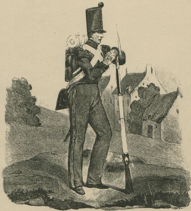
ÉLÈVE DE L'ÉCOLE MILITAIRE EN TENUE DE PARADE, A L'ÉPOQUE DE LA CONSTITUTION DE L'ÉCOLE.